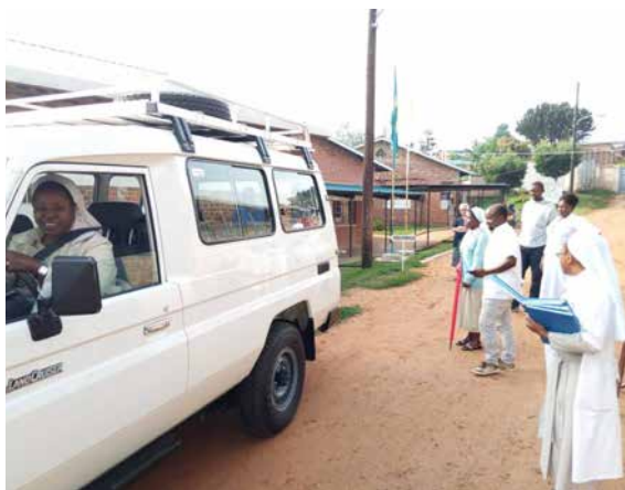
Nueva ambulancia para el Centro de Salud de Nyarusange (Ruanda).