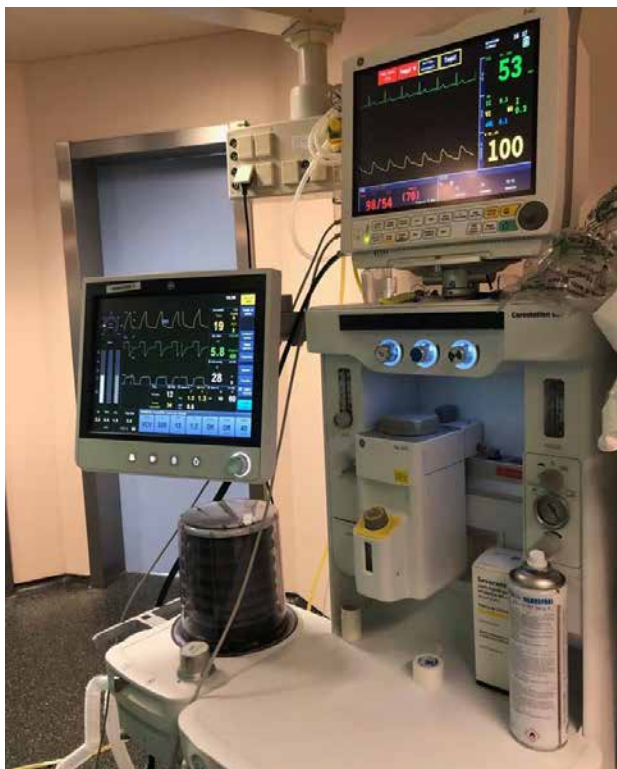
Respirador de quirófano.