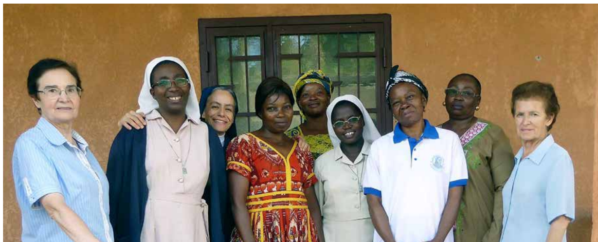
Simpatizantes del Carisma, en Nkolondom (Camerún).