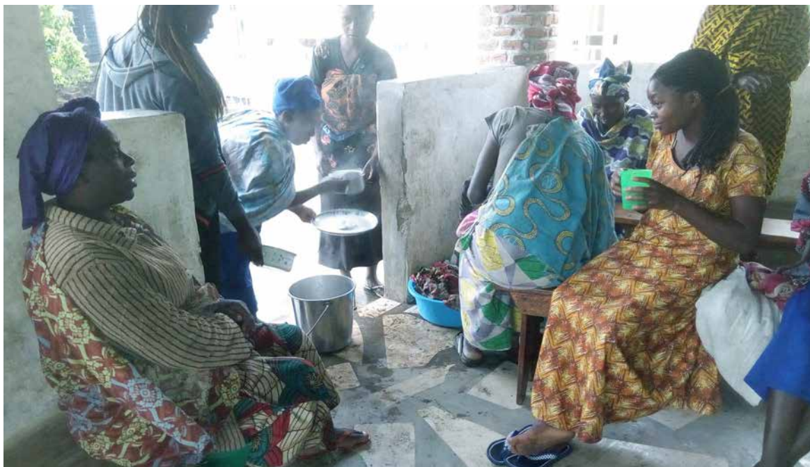
Desayuno para enfermos hospitalizados. Centro de Salud de Nyarusange (Ruanda).

Nuestra Obra está basada en los principios del humanismo cristiano y de la responsabilidad con la sostenibilidad y el medio ambiente. Sobre estos pilares hemos desarrollado diversas actividades como por ejemplo: