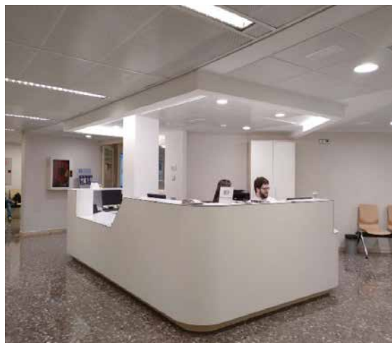
Recepción de consultas en la planta 1.