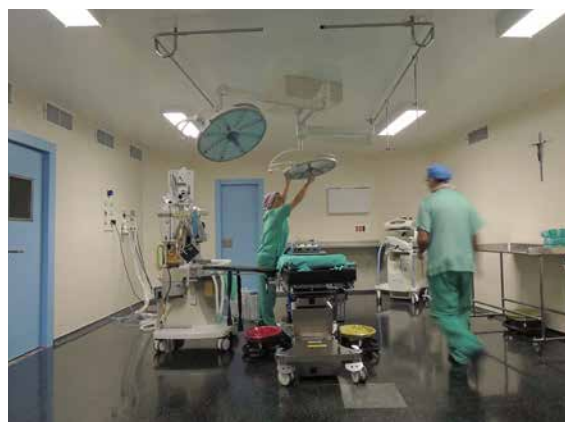
Quirófano número 6.