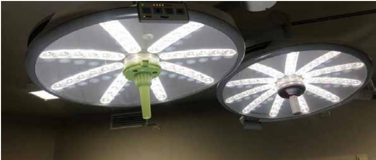
Nuevo equipamiento quirófono.