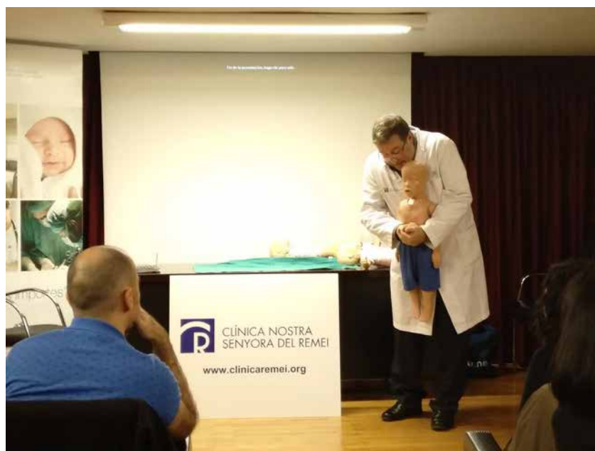
Taller de reanimación cardiopulmonar para familias.