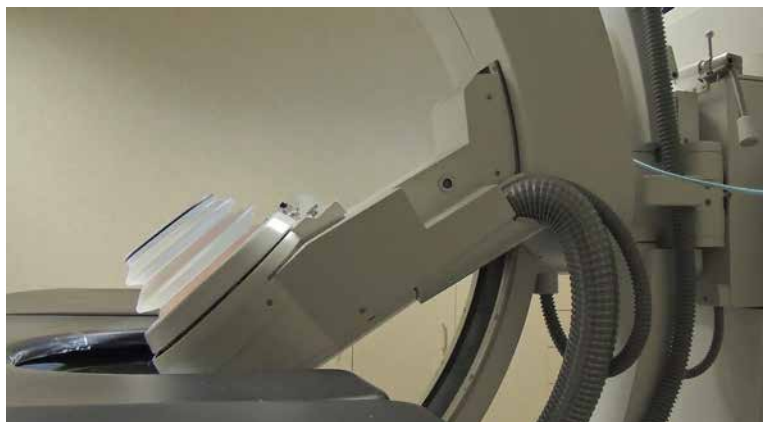
Unidad de Litotricias.

Braquiterapia Nutrición Dietética Farmacia Hospitalaria Fisioterapia Litotricia Ozonoterapia Psicología Rehabilitación Trastornos del Sueño Tratamiento del Dolor