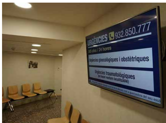
Sala de espera de urgencias.