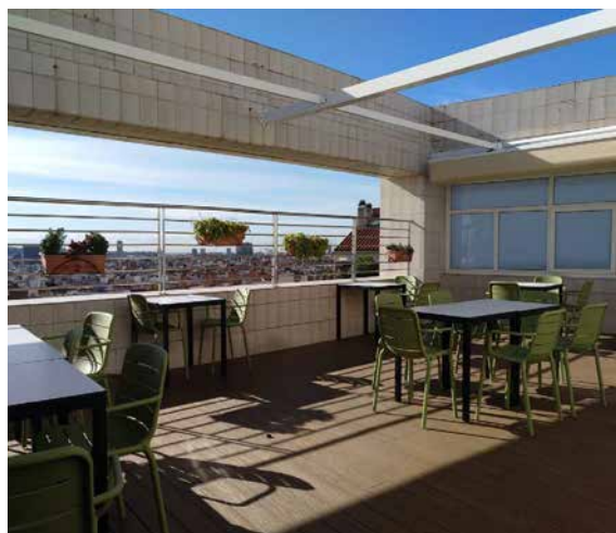
Terraza de la cafetería.

Para cumplir los indicadores de calidad se han establecido objetivos específicos para las siguientes áreas: Dirección Médica, Dirección de Enfermería, Administración y Recursos Humanos.