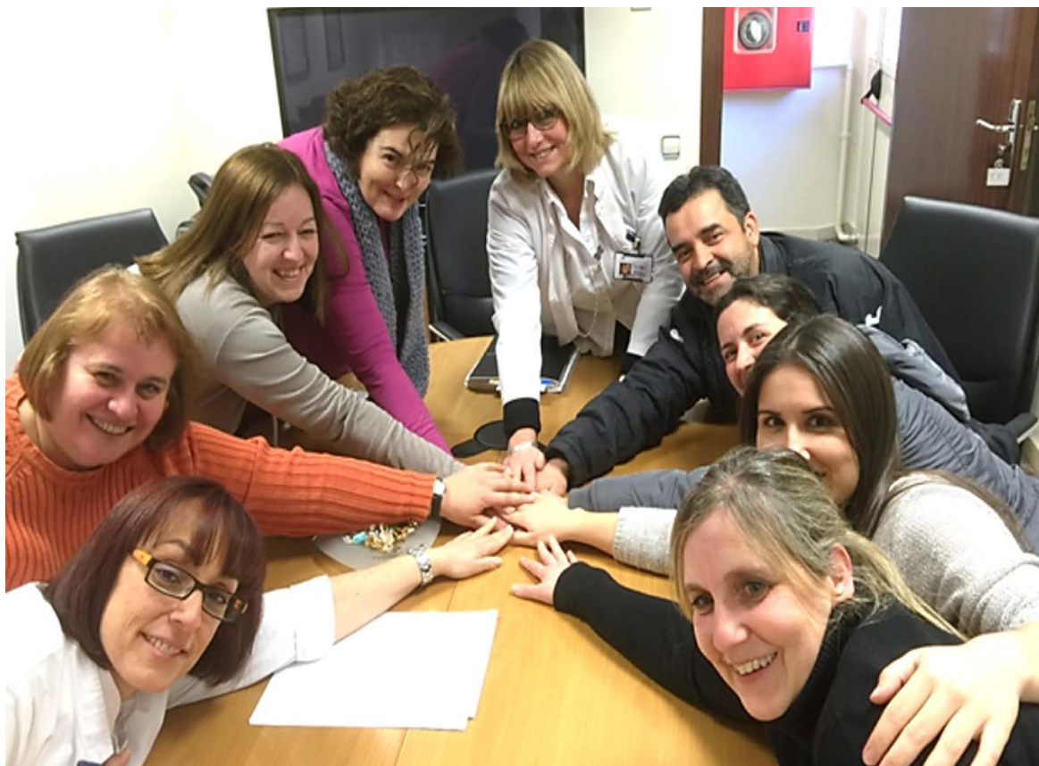
Formación en el turno de noche.

Además, se ha realizado formación más técnica, como puede ser el curso sobre utilización de la terapia inhalada o el curso sobre la seguridad de los pacientes; ambos han tenido un gran éxito entre los participantes que han elogiado tanto el contenido como la forma de impartirlo.