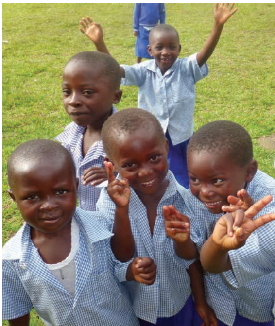
Alumnos del Centre d'Éducation Rubare (RD del Congo).