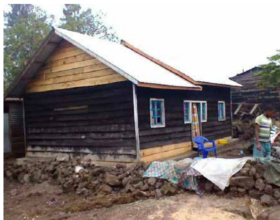
Casa construida para una familia en situación de vulnerabilidad.

A lo largo del año, el Equipo de Misiones ha participado en distintas actividades, en representación del Instituto y su Obra, con el objetivo de informar y sensibilizar sobre las problemáticas sociales, sanitarias y medioambientales que se viven en los países en los que tenemos presencia.