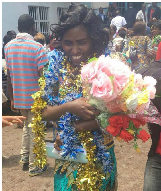
Graduación de una de las universitarias becadas.