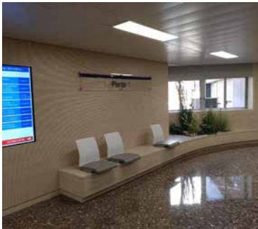
Hall y directorio de la planta 1.

Inversiones en equipamientos e infraestructuras: 508.000 €